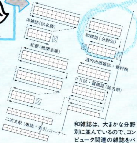
<雑誌閲覧室の配置>

和雑誌は、大まかな分野 別に並んでいるので、コン ピュータ関連の雑誌をバ ックナンバーも含めて手 あたりしだいに探してみた。